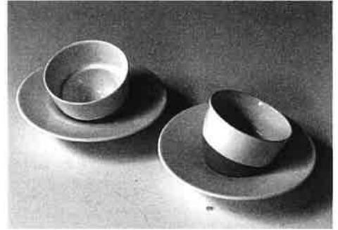
【介護時代の福祉食器の商品開発】 自在碗(丸碗・ソーサー) 平成12年(2000)