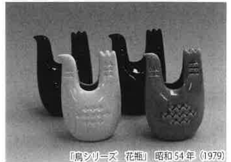
「鳥シリーズ 花瓶」昭和54年(1979)

瀬戸窯業試験場は、瀬戸地域窯業界の要望に応え、昭和46年(1971)2月に「愛知県瀬戸窯業技術センター」として瀬戸市南山口町の丘陵地に開設されました。そして同地における約半世紀にわたる業務活動を経て、令和6年(2024)4月からは豊田市八草町にある「地の拠点あいち」内のあいち産業科学技術総合センターに移転しました。